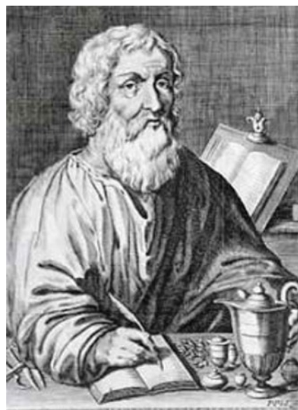
Рис. 1.1: Гіппократ

Слово «темперамент» (від лат. temperans, «помірний») в перекладі з латини означає «належне співвідношення частин», рівне йому за значенням грецьке слово «красис» (грец. κράσις, «злиття, змішування») ввів видатний давньогрецький лікар і філософ Гіппократ (5 ст. до н.е.). Він та його послідовники (римський лікар Гален та ін.) обстоювали гуморальну теорію (від лат. humor - рідина, соки організму: кров, флегма, жовч), згідно з якою ознаки темпераменту