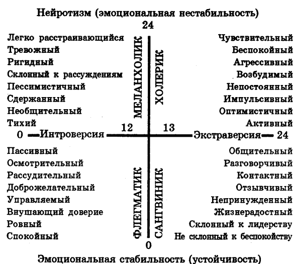
Рис. 2.1: Коло Айзенка

Люди меланхолічного темпераменту потребують особливої уваги внаслідок своєї вразливості, швидкої втомлюваності організму. Їм необхідне спокійне, сприятливе оточення та продуманий режим впливу, який передбачає